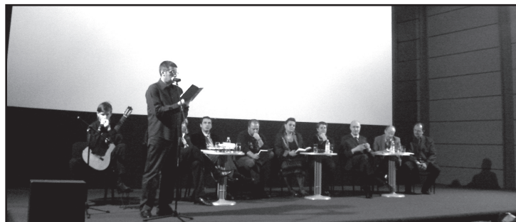
Ideja za knjigu je došla slučajno

ni bosanski običaji sa elementima propalih kulturno – historijskih vrijednosti. I.T.