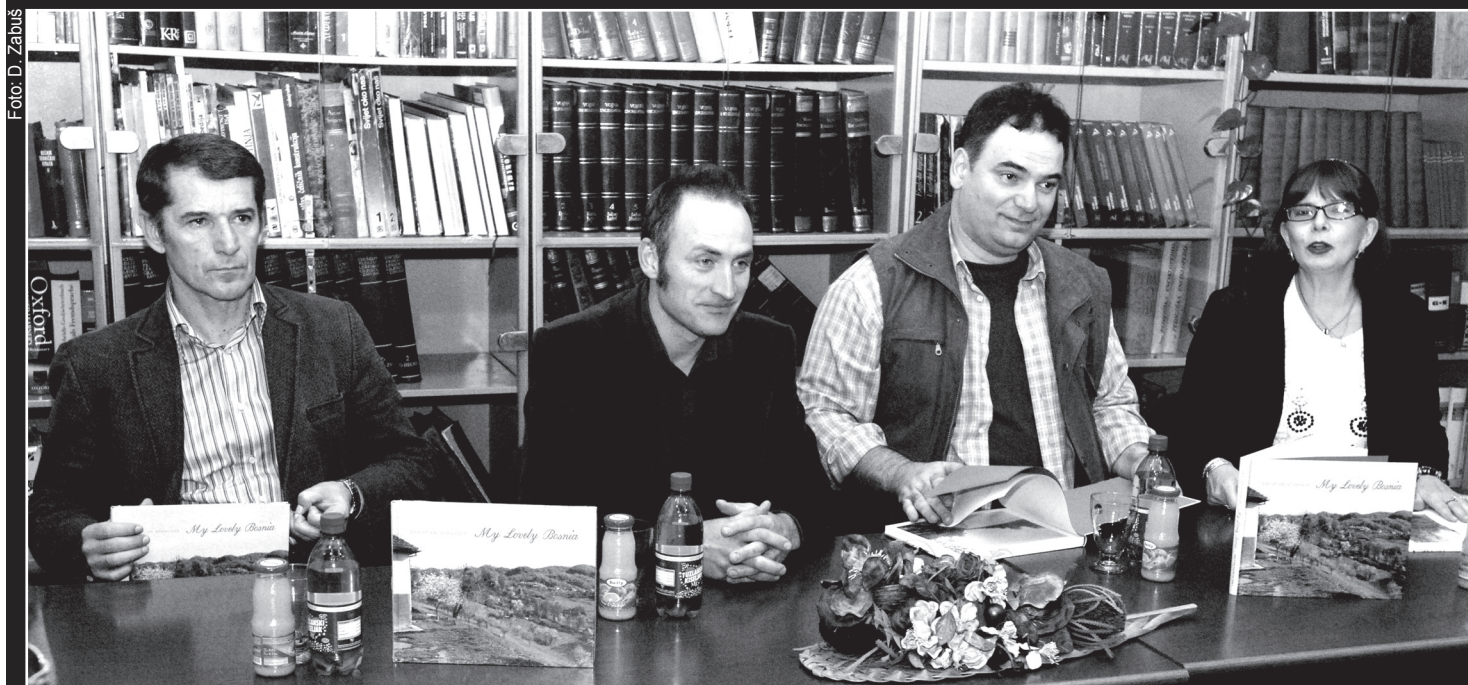
Nakon Tuzle „My lovely Bosnia“ bit će predstavljena u Švicarskoj

Fotografije nastale na sjeveroistoku Bosne • Radovi govore o tuzi i melanholiji